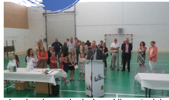
Avec la présence des écoles publique et privée

Sept mamans présentes ont été récompensées lors de la cérémonie de la fête des mères à la halle Michel Flandre le dimanche 4 juin. En présence des élus et d'un public venu nombreux, elles ont reçu une rose offerte par la mairie, un bon de 30€ par le CCAS à prendre chez les commerçants Capellois et un cadeau par l'association familiale. La cérémonie s'est clôturée avec le pot de l'amitié.