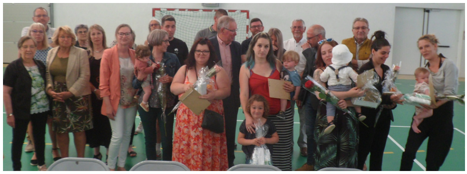
Les sept mamans présentes