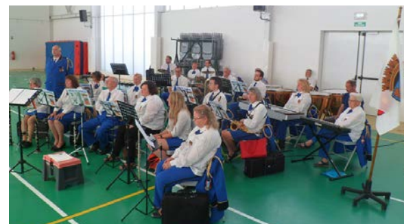
Avec la présence de l'harmonie de La Capelle

La bibliothèque départementale a mis en place des actions autour d'un fil rouge. Le thème du fil rouge 2023 était les arts visuels en bibliothèque. La médiathèque de La Capelle a choisi de travailler sur le roman "La perruche et la sirène" de Véronique Massenot qui est inspiré de l'œuvre éponyme de l'artiste Matisse. Un spectacle avec la classe de CP de l'école publique et avec l'aide de l'association Thiérache Promotion a été présenté le 6 juin dernier.