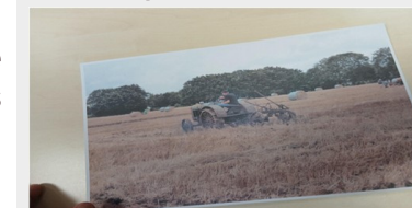
Le deuxième gagnant est Axel B en 6ème 1, grâce à la présentation du métier d'agriculteur.